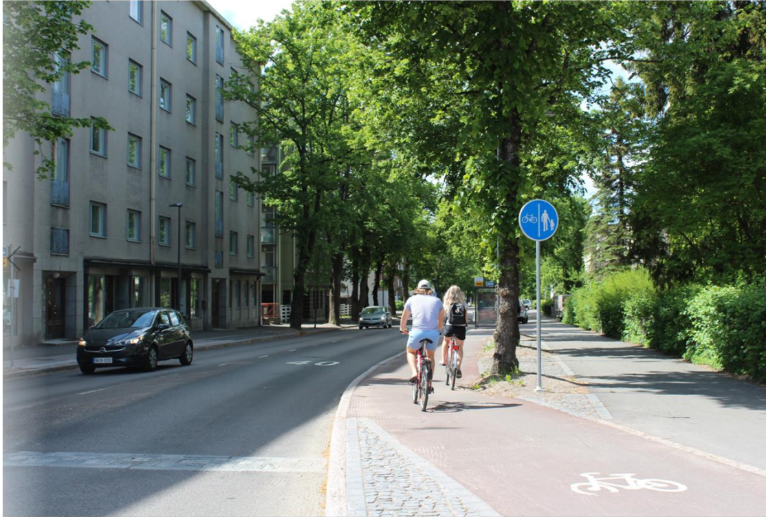
Esimerkki toteutetusta pääpyöräilyreitistä, jalankulku ja pyöräily eroteltu